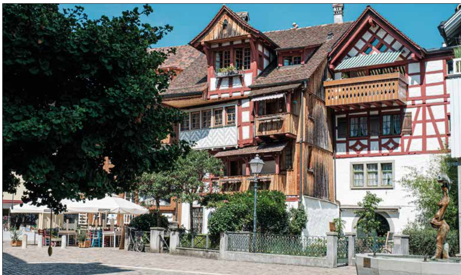
Le centre historique d'Arbon/TG.

L'ouvrage «La Suisse de A (rbon) à Z (oug), Portrait en 12 villes», paru chez EPFL Press, prend le contre-pied des études centrées sur les métropoles. Des chercheurs et chercheuses en sciences sociales racontent la ville qu'ils connaissent le mieux avec leur regard de spécialiste et celui du simple habitant.